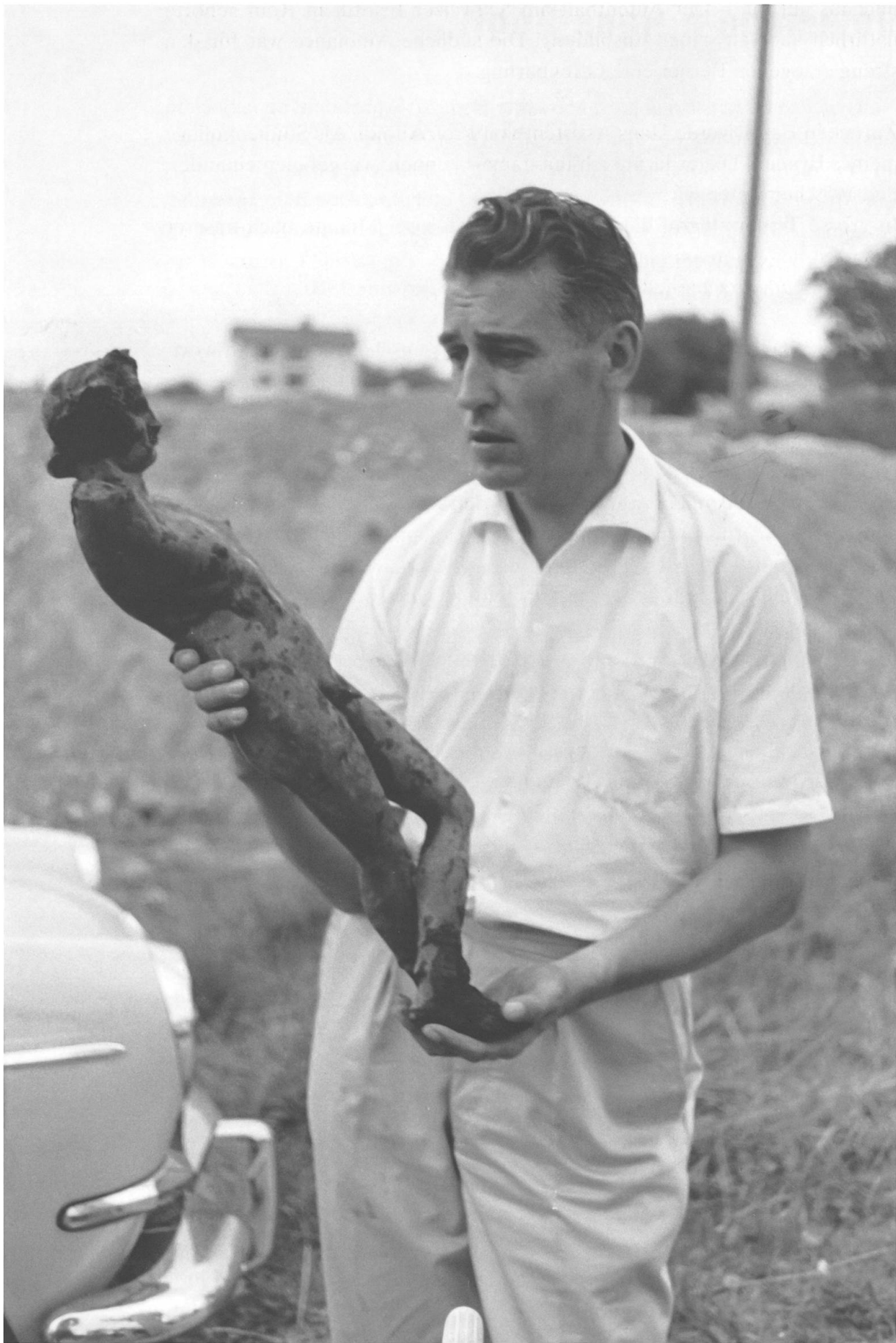
Découverte d'une statuette de Bacchus, à Avenches, Photographie SMRA, Avenches, 1966. ©AVENTICUVM – Site et Musée Romains d'Avenches