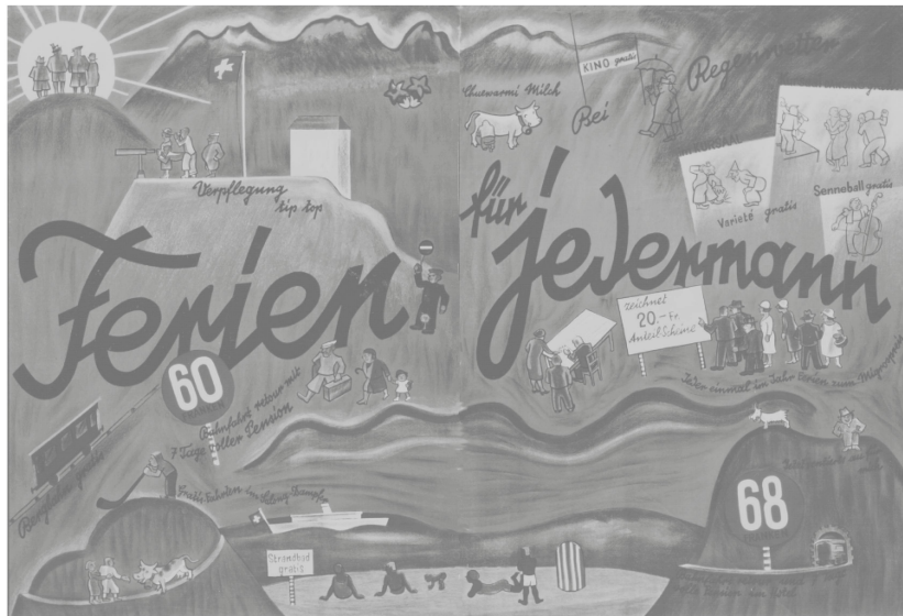
Abb. 1: Grossformatiges Plakat aus der Zeit der Genossenschaftsgründung (Mai 1935). Erhalten ist eine photographische Dokumentation, das Original eventuell nicht mehr.

die Schweiz, eindeutig durch die Flagge erkennbar. Nur etwas fehlte auf diesem Angebot des Paradieses, nämlich der Anbieter all dieser Herrlichkeiten zum Spottpreis. Eigenartigerweise findet sich der Name Hotelplan nicht. 6