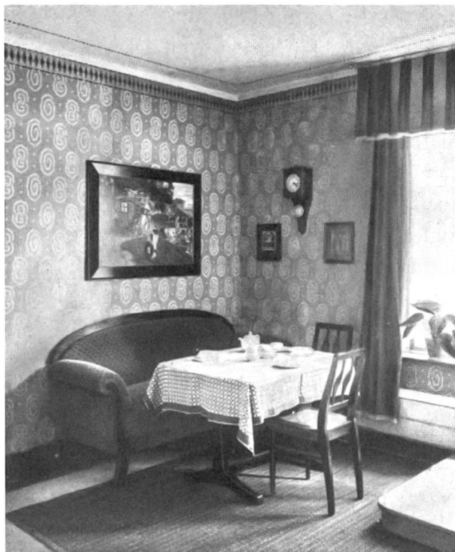
Abb. 2: Sofa-Ecke, nach einem Entwurf von Max Heidrich, Paderborn. Aus: Staudinger, Die Wohnung, S. 192.

Diese Raumorganisation und klare Raumzuordnung sticht ins Auge. Hier zeigt sich, dass Staudinger funktionalistischen Prinzipien folgte, wenn sie die Wohnräume den spezifischen Bedürfnissen der BewohnerInnen zuordnete. Die Raumordnung überlagerte sich mit der sozialen Ordnung der bürgerlichen Kleinfamilie, die auf einer geschlechtlichen Arbeitsteilung fusste. In einem Raum, der den Bedürfnissen einer spezifischen, kleinen, familiären Gruppe entsprach, konnte schliesslich so etwas wie Intimität entstehen. 23 Die eigene Wohnung wurde zum Privatraum, dessen Nutzung der Kernfamilie vorbehalten war. Für Kost- und Schlafgänger oder für eine repräsentative «gute Stube» war in den Reformwohnungen kein Platz vorgesehen – ebenso wenig wie für ledige Frauen und Männer. Während die soziale Idee hinter der funktionalistischen Raumzuteilung also die individuelle Bedürfnisbefriedigung und die Herstellung von Intimität ermöglichte, wirkte sie gleichzeitig disziplinierend und ordnend.