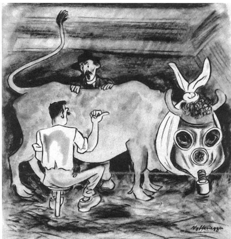
Abb. 1: Karikatur von 1943 im «Bärenspiegel» über die in der Resolution der Utzenstorfer Bauern enthaltene Befürchtung, «dass die Bewirtschaftung der in der Flugplatz-Umgebung liegenden Landkomplexe sehr nachteilig beeinflusst werde durch den grossen Lärm, [...] Benzingestank usw.» Aus: Bärenspiegel 21/5 (1943), S. 17.

[...] eine sehr starke Unruhe bemächtigt» habe. Von den «massgebenden Behörden» wurde gefordert, «dass sie von der Erstellung eines Grossflugplatzes [...] Umgang nehmen. [...] Eine freiwillige Abtretung des Land- und Waldareals» komme «niemals in Frage». Notfalls würden «sich die betreffenden Grundbesitzer einmütig und mit allen ihnen zur Verfügung stehenden gesetzlichen Mitteln gegen die Wegnahme des Bodens wehren». Eine nähere Untersuchung der in der Resolution entfalteten Argumentation zeigt, dass die Bauern insbesondere wirtschaftliche Nachteile fürchteten. So glaubten sie etwa, dass sie im Fall einer Realisierung des Flughafens durch eingeflogene Produkte, wie «Südfrüchte, Gemüse, Gärtnereiprodukte usw.» konkurrenziert würden. Weiter wurde vermutet, die geplanten Rodungen brächten «eine Verschlechterung des Klimas und eine Erhöhung der Hagelgefahr» mit sich. Befürchtet wurde aber auch eine «sehr nachteilige» Beeinflussung «der in der nähern Umgebung liegenden Landkomplexe» durch «den grossen Lärm, Scheuwerden der Pferde, Benzingestank und so weiter». 52