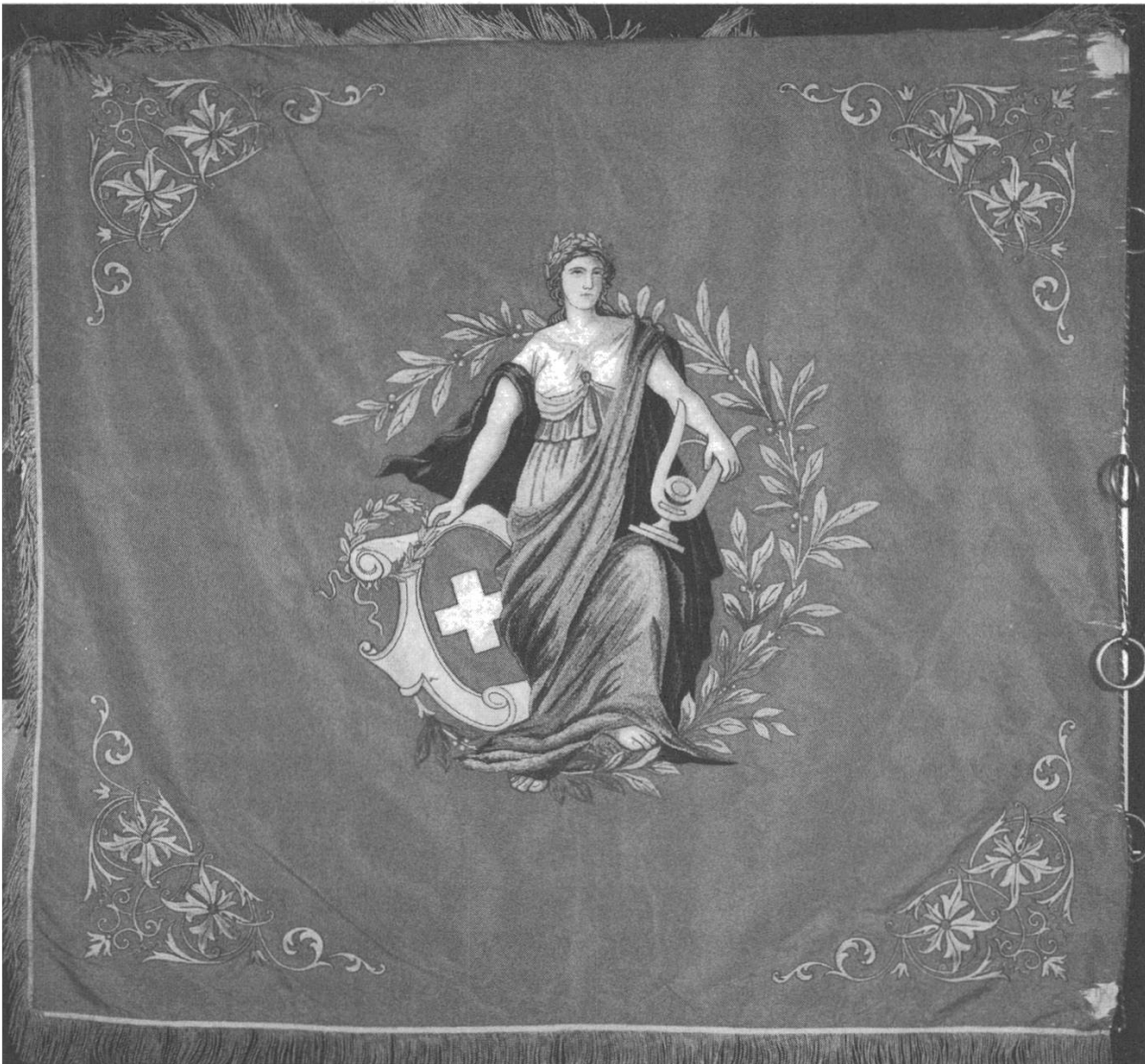
Abb. 1: Figur der Helvetia auf der Rückseite einer seidenen Fahne unbekanntes Datums.

finanziellen Angelegenheiten verzeichnet sind, ist es unwahrscheinlich, dass der Erwerb einer Fahne – sei es als Anschaffung des Vereins oder als Geschenk an diesen – nicht erwähnt worden wäre. Somit liegt es nahe zu vermuten, dass diese für eine frühere, das heisst vor 1898 existierende Swiss Society of New South Wales angefertigt worden war.