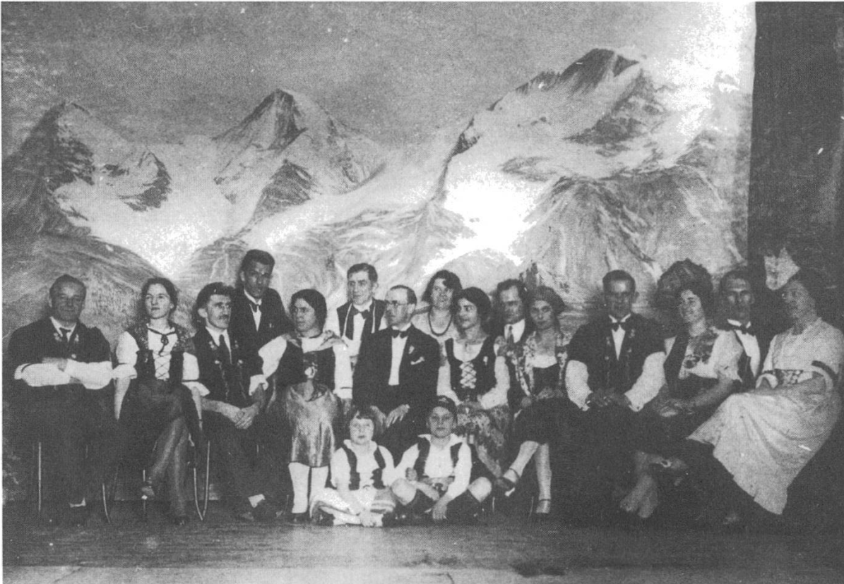
Abb. 3: Mitglieder des Swiss Club of New South Wales anlässlich der Bundesfeier von 1931 in Sydney.

festzustellen, zu welchen Zeiten einzelne Symbole anderen vorgezogen wurden, und zu untersuchen, inwiefern diese Präferenzen demografische Veränderungen innerhalb der Schweizer Gemeinschaft reflektieren.