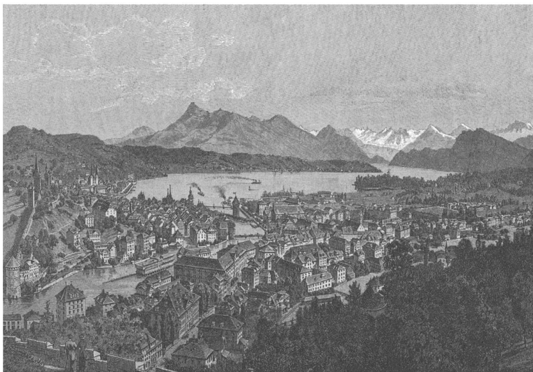
Abb. 2: Ansicht Luzerns vom Gütsch. (Verkehrskommission Luzern [Hg.], Führer für Luzern, Vierwaldstättersee und Umgebung, Luzern 1892)