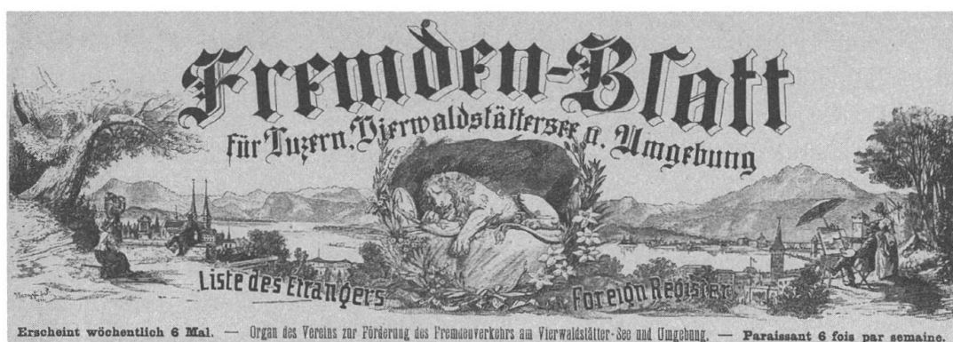
Abb. 3: Kopf des Fremdenblatts für Luzern, Vierwaldstättersee und Umgebung, 1891–1900, hier 2 (1985).

pektiven dargestellt: in Frontalansichten aus Norden oder Süden. In der Folge blieb die Ansicht aus Süden, vom Heiligberg aus, bedeutsam, doch zusätzlich wurde eine neue Perspektive gewählt: jene vom Bäumli, einem Hügel im Nordosten der Stadt. Emanuel Dejung, der sich ausführlich mit der Ikonografie Winterthurs beschäftigt hat, erwähnt die Ansicht von David Herrliberger von 1754 als erste