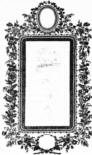
Ausrüstung von Stickereien.

Le 9 février 1885, à onze heures avant-midi. No 1331.