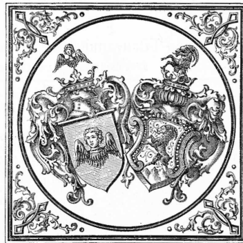
Anilin-Farben, Alizarin und chemische Produkte. (Uebertragung der unter No 297 auf die Firma « Bindschedler Busch & C ie » in Basel eingetragenen Marke.)

Gesellschaft für Chemische Industrie in Basel, Basel.