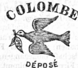
Mouvements, boîtes et cadrans de montres.

Albert Jeanneret & frères, fabricants, St-Imier.