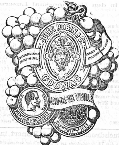
Eaux-de-vie de Cognac.

Jules Robin & C ie , négociants, Cognac (France).