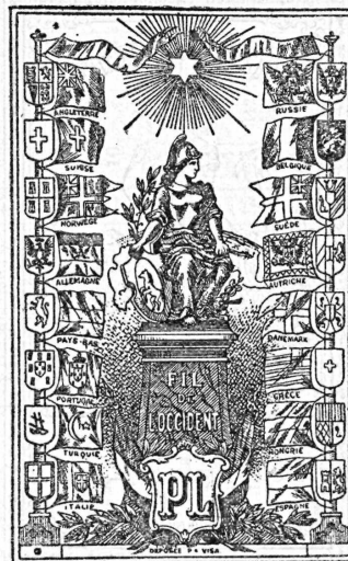
Fils de lin, de coton ou autres.

Poullier-Longhaye , fabricant, Lille (France).