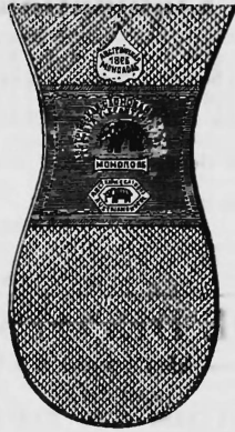
Gummschuhe, sowie andere Schuhe aller Art mit Gummisohlen.