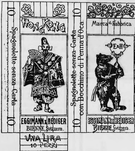
Cigarren und Cigaretten.

Eggimann & Hediger, Fabrikanten, Biel (Schweiz).