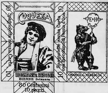
Cigarren und Cigaretten.

Eggimann & Hediger, Fabrikanten, Biel (Schweiz).