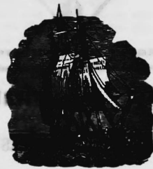
Destillierprodukte und kohlen-saure Getränke.

Joh.-B. Lang , Fabrikant, Kriens (Schweiz).