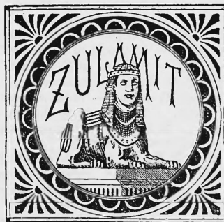
Cigares, cigarettes et tabacs.