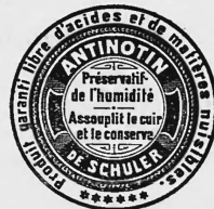
Graisse pour le cuir.

N° 9527. — 22 septembre 1897, 4 h. p. Carl Schuler & Co, fabricants, Kreuzlingen (Suisse).