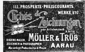
Genève 1896: Médaille d'argent.

Italie Agence d'affaires Contentieux commercial G. Saxer (307) 19, Rue Alfieri, Turin Références de premier ordre