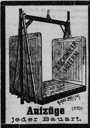
Aufzüge (970) jeder Bauart.

Zürcher, gesetzten Alters, viel gereist, sprachgewandt, bilanzfähig, mit prima Referenzen, sucht per sofort oder später Stelle. Offerten unter Chiffre Z U 5820 erbeten an Rudolf Mosse in Zürich. (1543)