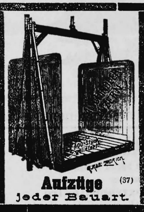
Rudolf Mosse, Zürich-Bern.