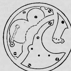
N o 12.