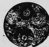
N o 4.