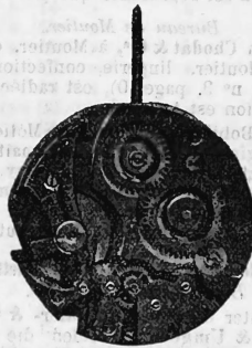
N o 193.