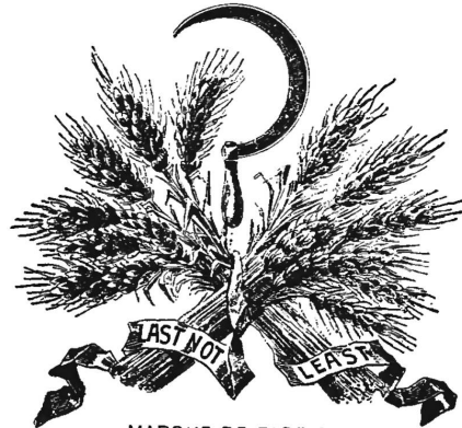
MARQUE DE FABRIQUE DEPOSÉE

(Uehertragung von Nr. 14406 der Firma Tommasini, Pontelli & Co.)