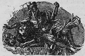
MARQUE DÉPOSÉE "CONSERVES SAXON", (Renouvellement dn n° 6871.)