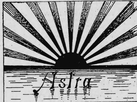
(Transmission du n° 39499 de la Berna Milk Company, Thoun).

Graisses et huiles comestibles et autres produits alimentaires.