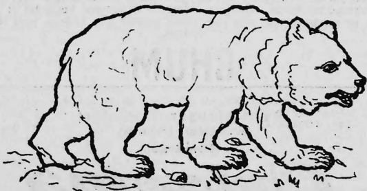
(Erneuerung der Nr. 15836).

Papierfabrik Utzenstorf (Papeterie d'Utzenstorf), Fabrikation, Utzenstorf (Schweiz). Postpapier, Schreibpapier und Frachtbriefpapier.