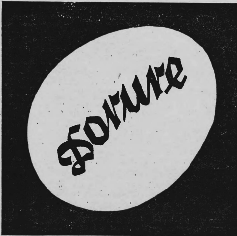
(Die Marke wird gelb, weiss und schwarz ausgeführt).

Nr. 71329. — Hinterlegungsdatum: 21. November 1929, 17¼ Uhr. E. Scheidegger & Söhne, Fabrikation, Wiedlisbach (Bern, Schweiz). Anstreichmittel für Backwaren.