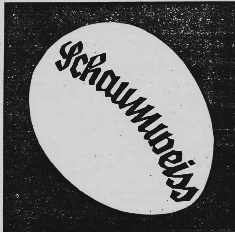
(Die Marke wird gelb, weiss und schwarz ausgeführt).

E. Scheidegger & Söhne, Fabrikation, Wiedlisbach (Bern, Schweiz). Eiweiss-Schneeschlagentmittel.