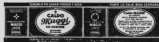
(Marque imprimée en rouge sur fond jaune).

Bouillons et consommés sous toutes formes, par exemple sous forme liquide, solide, pâteuse.