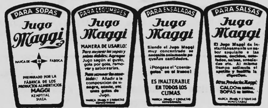
(Marque imprimée en rouge sur fond jaune).

Aromes et condiments sous toutes formes, par exemple sous forme liquide, solide, pâteuse.