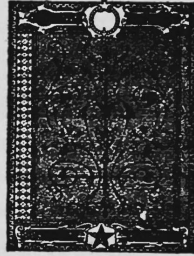
(La marque est exécutée partiellement en rouge).

Papier, à savoir papiers de soie de toutes sortes, papier de toilette, papier à lettres, papier pour machines à écrire, couvertures, et papier d'échantillons.