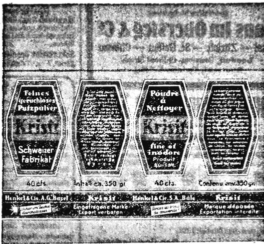
(Die Marke wird in orange, dunkelblauer, blaugrauer und weisser Farbe ausgeführt.)

Reinigungsmittel, Seifen aller Art (auch parfümierte), Seifenpulver, Soda, Bleichsoda, Stärke und alle andern Waschmittel.