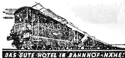
DAS GUTE HOTEL IM BAHNHOF-NAHE!