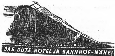
DAS GUTE HOTEL IN BAHNHOF-NAHE!

Le bilan et le compte de profits et pertes, ainsi que le rapport du vérificateur sont à la disposition de MM. les actionnaires à l'Union de Banques Suisses, à Lausanne, où ils peuvent être consultés.