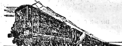
DAS BÜTE HOTEL IN BAHNHOF-WÄHE!

Zeichnungen werden spesenfrei entgegengenommen von sämtlichen Niederlassungen der Banken, die diesen Prospekt unterzeichnet haben. 241