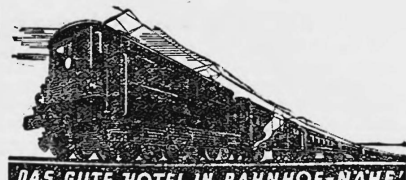
DAS GUTE HOTEL IN BAHNHOF-NÄHE!