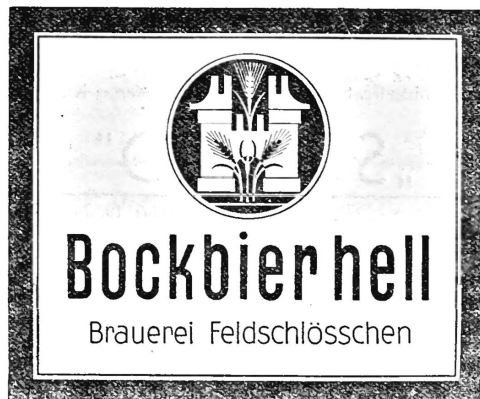
(Die Marke wird gelb, gold, grün und schwarz ausgeführt.)