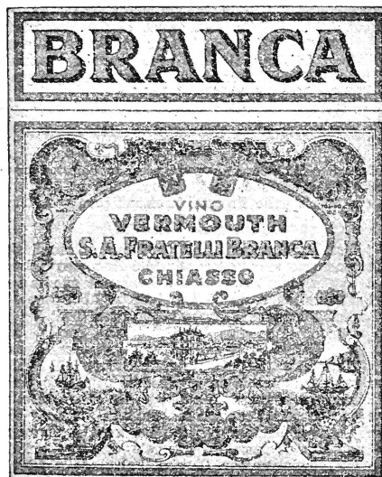
(La marque est exécutée en blanc, rouge, orange, bleu, noir et or.)

N° 93498. Date de dépôt: 24 mai 1938, 18½ h.