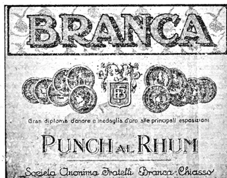
(La marque est exécutée en blanc, noir, rouge et brun.)