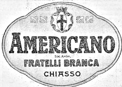
(La marque est exécutée en jaune, or, bleu, noir et rouge.)

N° 93494. Date de dépôt: 24 mai 1938, 18½ h.