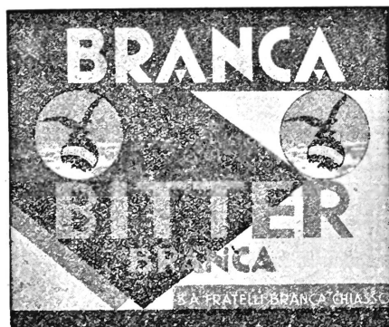
(La marque est exécutée en blanc, bleu, rouge et noir.)

N° 93496. Date de dépôt: 24 mai 1938, 18½ h.