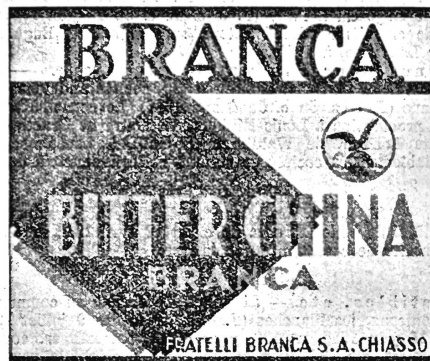
(La marque est exécutée en blanc, rouge, noir, bleu et or.)

N° 93497. Date de dépôt: 24 mai 1938, 18½ h.