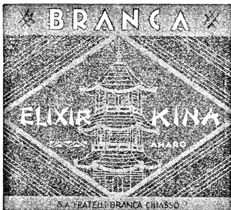
(La marque est exécutée en rouge, or, noir et blanc.)

N° 93495. Date de dépôt: 24 mai 1938, 18½ h.