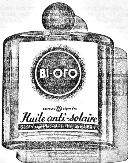
(Farbenausführung: weiss, orange und blau.)

Nr. 96310. Hinterlegungsdatum: 25. Juli 1939, 8 Uhr. Gesellschaft für Chemische Industrie in Basel, Basel (Schweiz). Fabrik- und Handelsmarke.