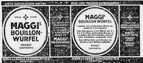
(Marke in drei Farben: rot und schwarz auf gelbem Grund.)

Nahrungs- und Genussmittel, diätetische, pharmazeutische, chemische und landwirtschaftliche Erzeugnisse und Waren aller Art.