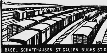
BASEL SCHAFFHAUSEN ST. GALLEN BUCHS ST. G.

Von Schweden nach der Schweiz unterhalten wir einen regen Spezial- u. Sammelverkehr. Durchfrachten ab allen skandinavischen Stationen. - Weltfurrer verfügt über reiche Erfahrung aus 3 Jahrzehnten.