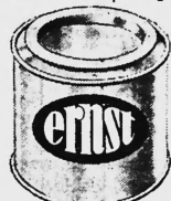
Ernst & Co Blechdosenfabrik Kusnacht (Zürich)