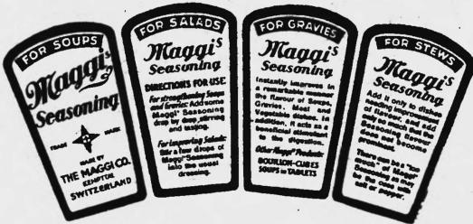
Die Marke wird gelb und rot ausgeführt.

Nr. 114746. Hinterlegungsdatum: 22. März 1946, 18 Uhr. Fabrik von Maggis Nahrungsmitteln, Kempththal (Schweiz). Fabrik- und Handelsmarke.