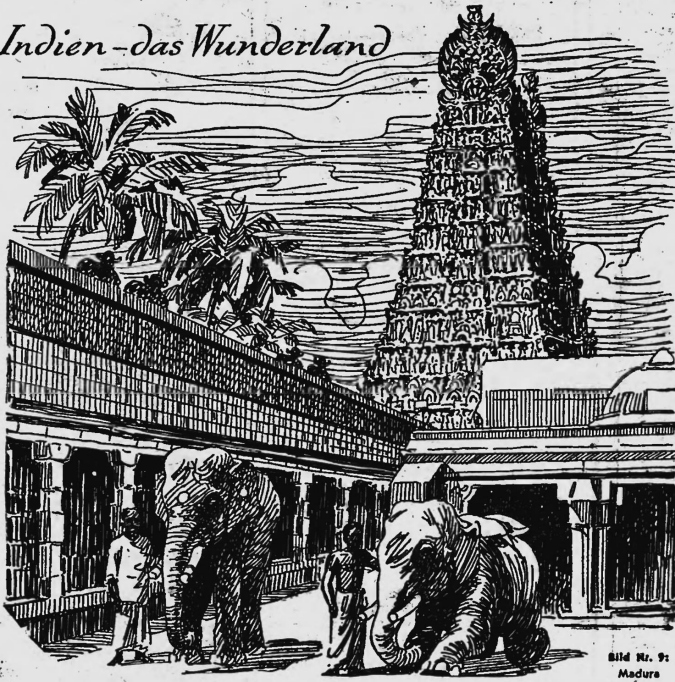
Bild Nr. 91 Madure

Indiens Märchenwelt, mit seinen marmorweißen Palästen und Denkmälern, seinen zauberhaften Pagoden, war für den Europäer von jeher ein Land der Sehnsucht und Träume. Wir sind durch die