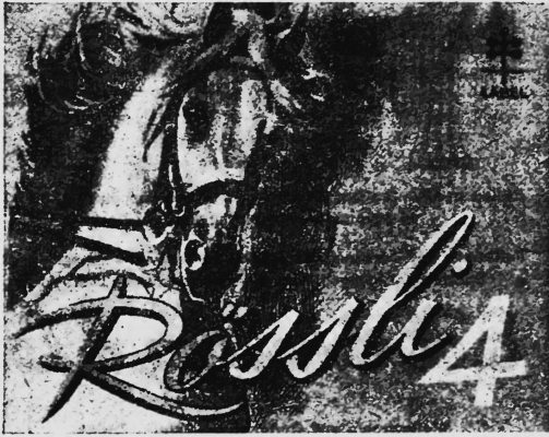
Farbenanspruch: Schimmel auf orangem Grund, Schrift orange und gelb, Ziffer weiss.

Nr. 128880. Hinterlegungsdatum: 3. Mai 1949, 19 Uhr. Burger Söhne, Burg (Aargau, Schweiz). — Fabrik- und Handelsmarke. Tabakwaren, insbesondere Stumpfen.