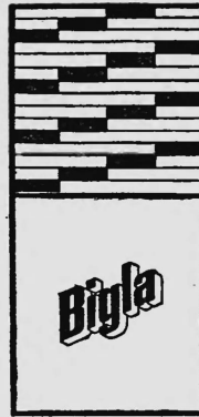
Bigler, Spichiger & Cie. AG

Entweder bedingt der Jahreswechsel neue Dosiers und Änderungen im Registratorwesen oder denn entscheidet man sich zur völligen Reorganisation und in diesem Falle ist die Bigla-Einrichtung (Vertikalschränke, Hängerregistrator, Glasscheibe und Zählkarten) willkommen. Verlangen Sie unsere Spezialprospekte oder Vertreterbesuch.