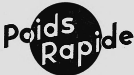
Tableau comparatif pour poids du bétail.

N° 131772. Date de dépôt: 2 novembre 1949, 9 h. Alexandre Portlanucha Laboratoire Diamant, rue de la Tour 2, Genève (Suisse). — Marque de fabrique et de commerce.