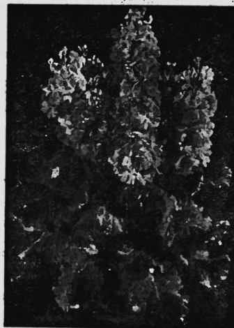
PRIMULA MALACOIDES CHARME

Blumensamen Primula malacoides (Fliederprimel).