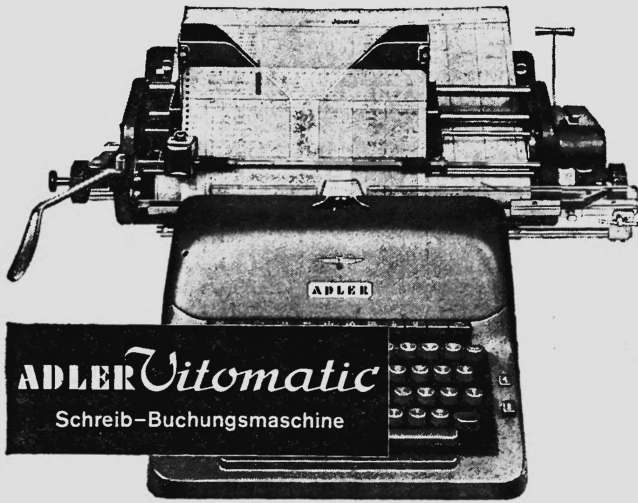
ADLER Vitomatic Schreib-Buchungsmaschine

Mit verbundenen Augen können Sie die Kontenkarte schreibfertig, zeilen gerade und auf die richtige Buchungszeile einstellen. Kein Richten — ein Hebelzug genügt!