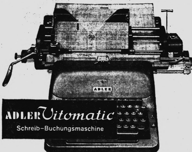
ADLER Vitomatic Schreib-Buchungsmaschine

Mit verbundenen Augen können Sie die Kontenkarte schreibfertig, zeilengerade und auf die richtige Buchungszeile einstellen. Kein Richten — ein Hebelzug genügt!