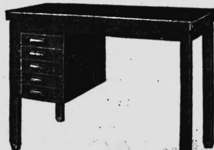
TABLE DACTYLO depuis 218.-