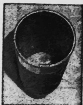
Faß mit Poly-Felba-Rundbodensack ausgekleidet