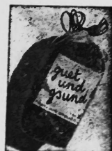
Poly-Felba-Kreuzbodenbeutel mit Kordelzug