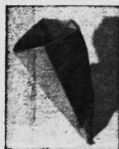
Papiersack mit Poly-Felba-Sack ausgekleidet