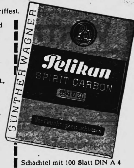
Schachtel mit 100 Blatt DIN A 4

Bei den Sorten 994 wird die saubere Handhabung durch eine zusätzliche Schutzschicht noch verbessert.