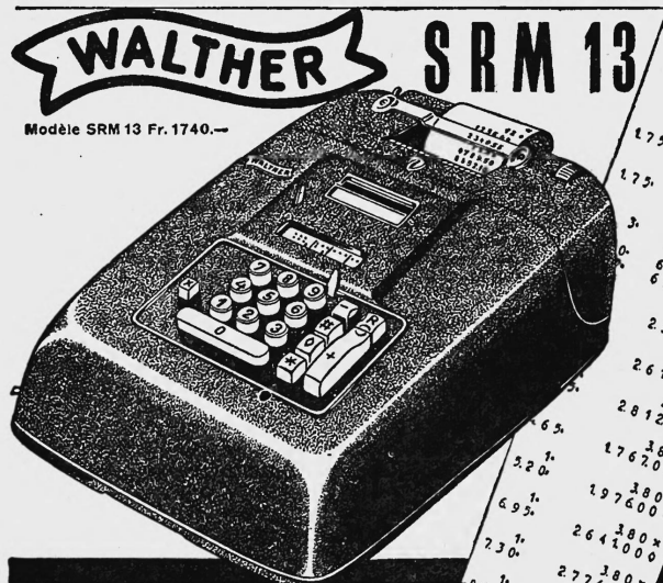
Modèle SRM 13 Fr. 1740.—