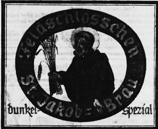
Die Marke wird braun, golden, gelb und schwarz ausgeführt.

Nr. 171885. Hinterlegungsdatum: 2. September 1958, 18 Uhr. Brauerei Feldschlösschen, Rheinfelden. — Fabrik- und Handelsmarke. Erneuerung der Marke Nr. 93370. Die Schutzfrist aus der Erneuerung läuft vom 12. Juni 1958 an.