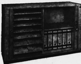
Mod. 1027 T E

Neue Schrankmodelle mit betont wohnlichem Charakter