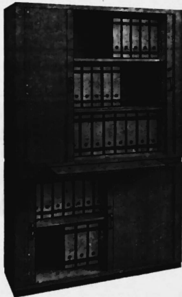
Mod. 1021 T + 1020 T

Neue Schrankmodelle mit betont wohnlichem Charakter