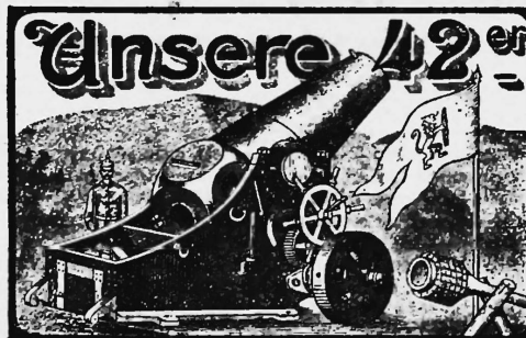
La Grosse Bertha — Die Dicke Berta (27. 11. 1914)

Beim Durchblättern der Markensammlung wird der Historiker die beiden Weltkriege im Bild wiedererleben, mit all ihren Uniformen und verschiedensten Waffen.