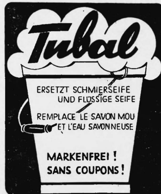
Les produits de remplacement en 1941 — Ersatzprodukte im Jahr 1941 (25. 10. 1941)

Er wird sich der Einweihung der Traussibirischen Eisenbahn wieder erinnern, sowie das Auftauchen der ersten Strassenbahnen, des Phonographen oder Fahrrades wiedererleben; er wird auch die ersten «Aeroplanes» bewundern können und es werden ihm die Reisen der früheren Zeppeline wieder in Erinnerung gerufen, ebenso zum Beispiel die Konstruktion des Eiffelturms, der Tunneldurchstich durch den Simplon, der Stapellauf der Titanic, der Bau der Jungfrau, bis schliesslich die Fliegenden Teller und die Sputniks diesen Reigen beschliessen.