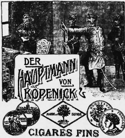
La célèbre affaire du Capitaine de Köpenick qui en 1906 secoua l'Europe d'un rite homérique Die Köpenickiade (13. 12. 1906)

So wird er auch feststellen können, dass die Affäre des Hauptmanns von Köpenick einen Zigarrenfabrikanten inspiriert hat, lange bevor sie den Stoff zu einem Roman lieferte oder auf der Bühne aufgeführt wurde.