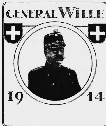
Le portrait du Général Wille — Bildnis des Generals Wille (6. 4. 1915)

Der Historiker wird darin zahlreiche Aspekte der kleinen wie der grossen Geschichte finden. So haben die Spalten des Schweizerischen Handelsamtsblattes auch die Bildnisse der drei ersten Generäle unserer Geschichte für die Nachwelt festgehalten, Portraits, die in der Folge auf unzähligen Likörfflaschen, Packungen von Stumpen und andern Erzeugnissen erscheinen sollten.