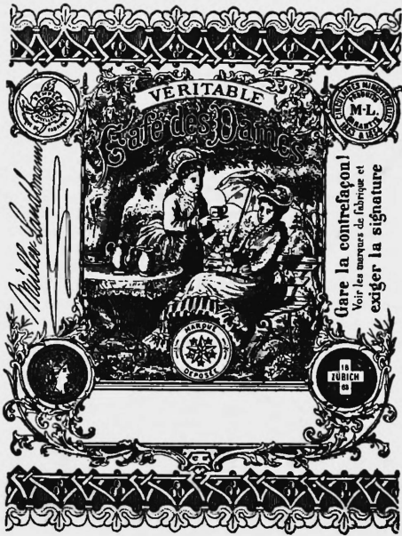
(27. 6. 1885) Les arts appliqués hier et aujourd'hui — Die angewandte Kunst gestern und heute (9. 2. 1955)

Es wird ihm auffallen, dass am Anfang und noch während längerer Zeit die Marken vorwiegend aus bildlichen Darstellungen bestanden haben, während heute die reinen Wortmarken die weitaus grösste Zahl der zur Hinterlegung gelangenden Zeichen bilden. Vom 1. November 1880 an, dem Tag der ersten Markenhinterlegung, sind mehr als 10 Jahre verstrichen, bis erstmals am 4. Juli 1891 ein reines Phantasiewort als Marke auf den Namen einer Schweizer Firma hinterlegt wurde («Knodalin», Marke Nr. 5352).