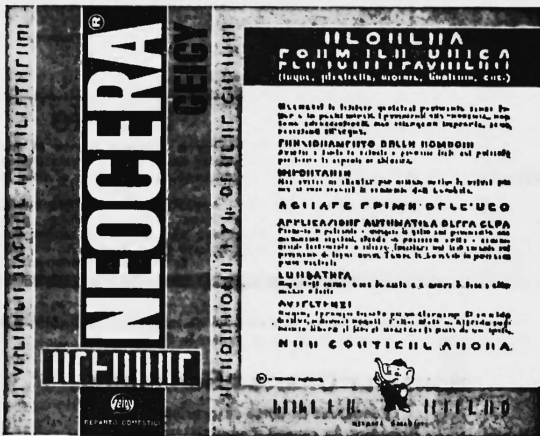
Die Marke wird rot, gelb, schwarz, weiss und beige ausgeführt.

Wachshaltige chemisch-technische Produkte.